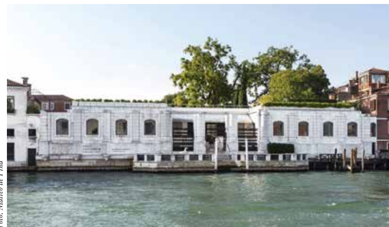
ONDER De Peggy Guggenheim Collection in Venetië.