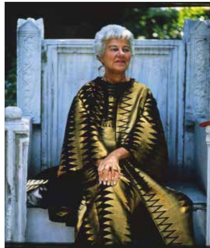
BOVEN EN LINKS Peggy Guggenheim in de tuin van haar Palazzo in Venetië.